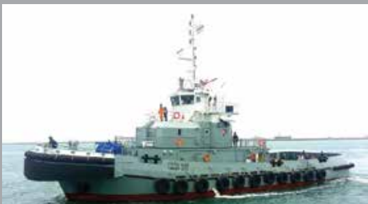
37.10 m. TUG BOAT