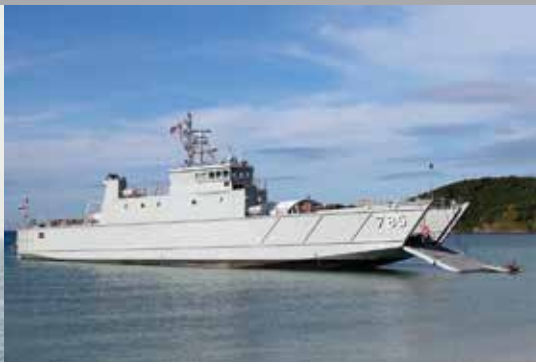
M55 LANDING CRAFT UTILITY