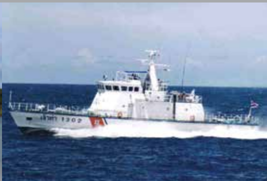
M39 PATROL BOAT