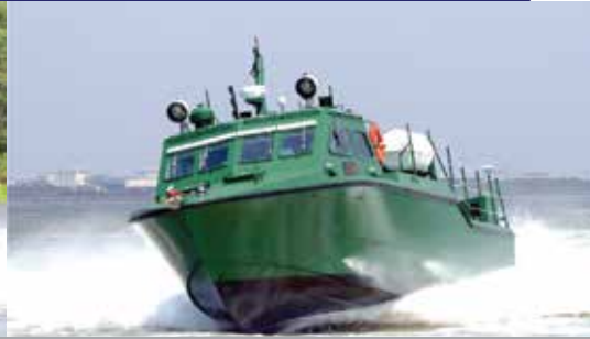
M16 FAST ASSAULT BOAT