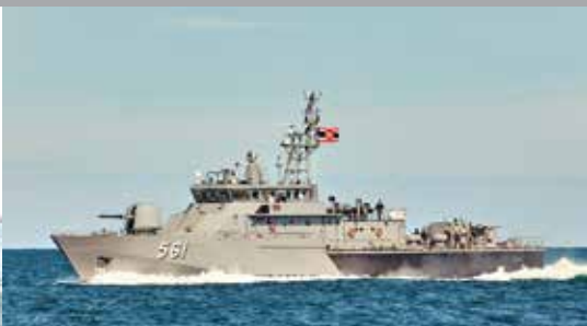
M58 PATROL GUN BOAT