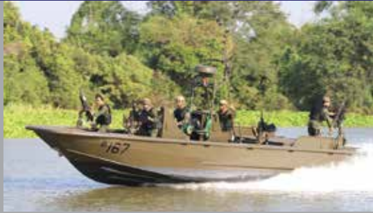
M10 RIVERINE PATROL BOAT