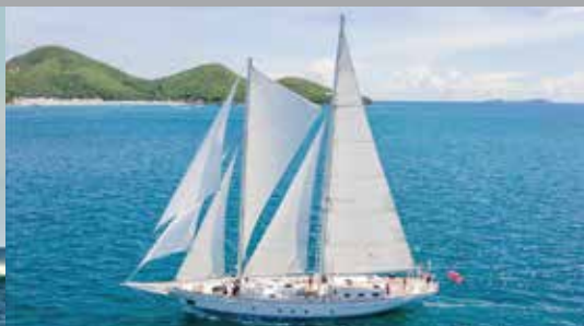
34 m. SAILING SCHOONER