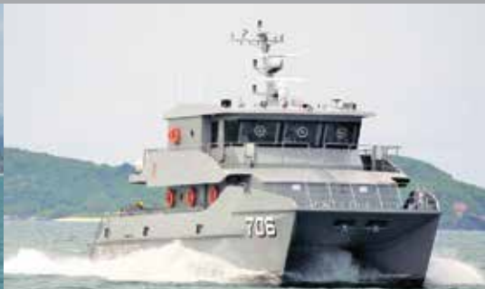
23 m. CATAMARAN PATROL BOAT