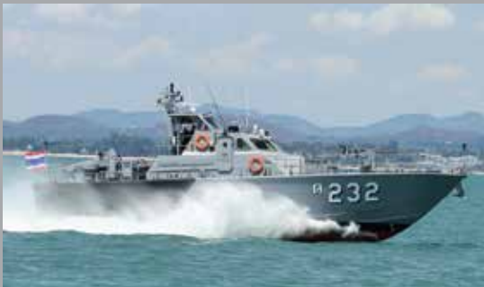
M21 PATROL BOAT