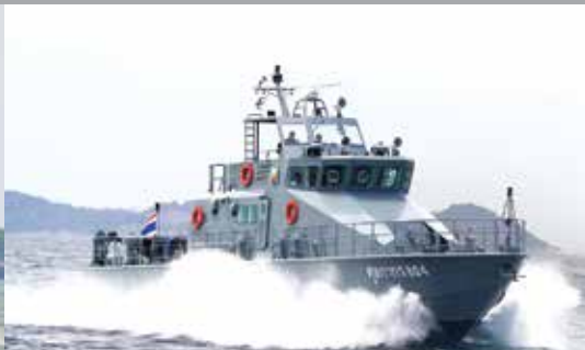
M25 PATROL BOAT