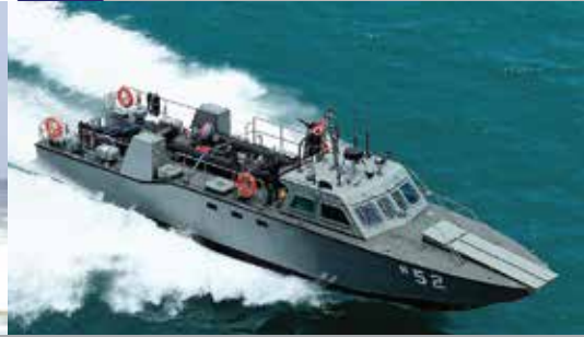
M18 FAST ASSAULT BOAT