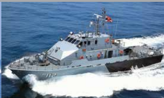
M36 PATROL BOAT