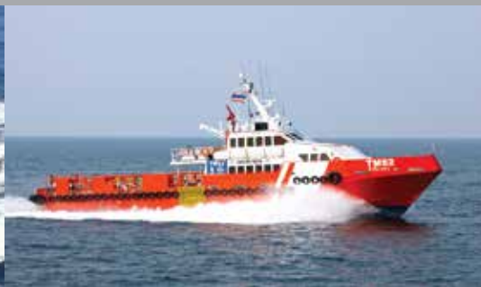
36 m. CREW/UTILITY BOAT