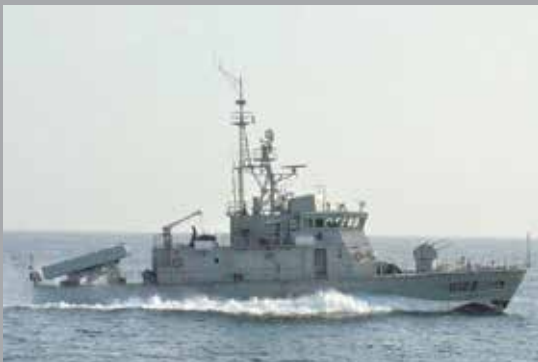
M39 FAST ATTACK MISSILE CRAFT