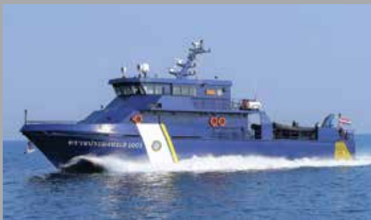
32 m. PATROL BOAT